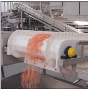
Tapis uni MPB à surface fermée

Avec uni-chains, vous trouvez la solution complète à toutes vos demandes et problèmes de convoyage - d'alimenteurs en gros jusqu'à l'accumulation des caisses. Nous avons développé des produits qui vont dépasser vos attentes si vous souhaitez un tapis facilement nettoyable, un tapis résistant aux impacts renforcés ou une chaîne résistante à l'usure.