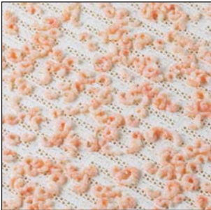
Tapis uni CNB ouvert à 18%